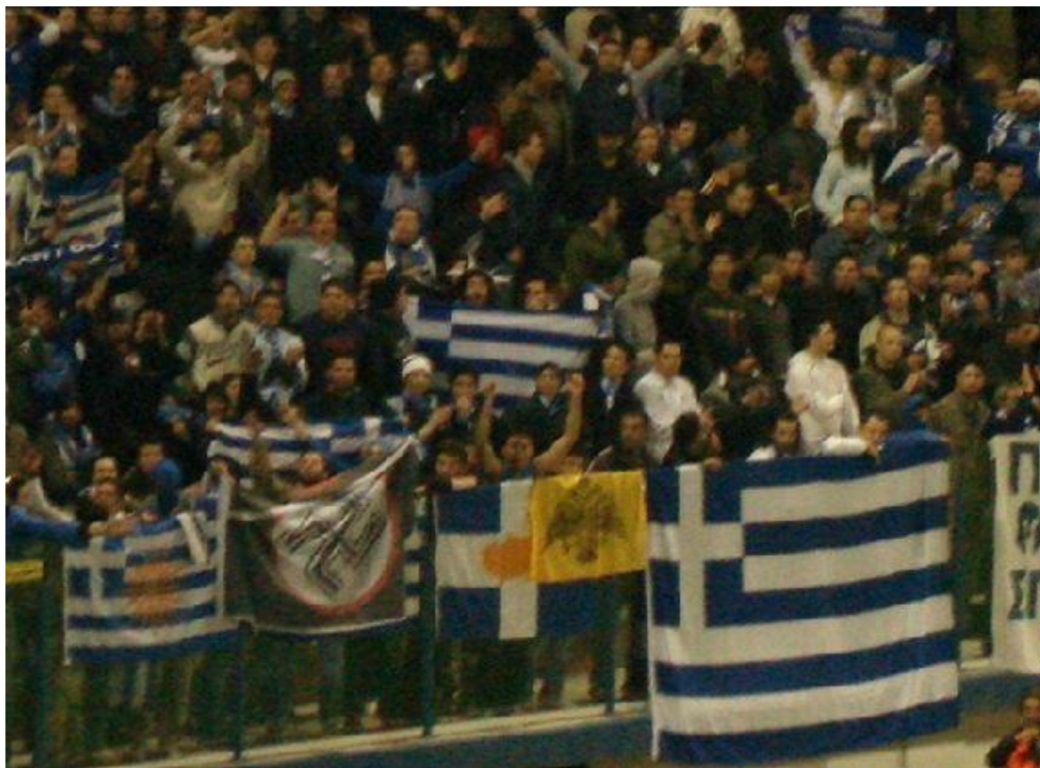
Ναζιστική σημαία σε κερκίδα Κυπριακής ποδοσφαιρικής ομάδας.